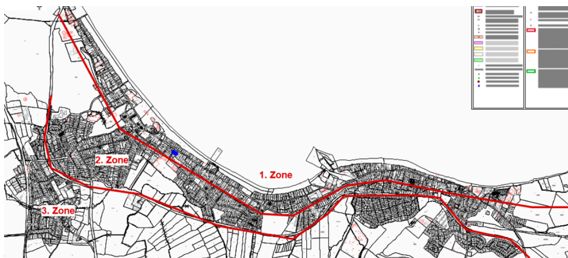
Bild 1: Zonierung vom 30.11.2017

Die beschriebene städtebauliche Gebietsstruktur soll aus Sicht der Gemeinde auch weiterhin beibehalten und in seiner Systematik vervollständigt werden.