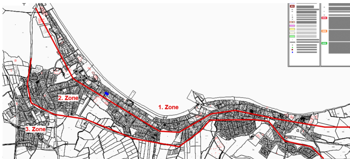
Bild 1: Zonierung vom 30.11.2017

Die beschriebene städtebauliche Gebietsstruktur soll aus Sicht der Gemeinde auch weiterhin beibehalten und in seiner Systematik vervollständigt werden.