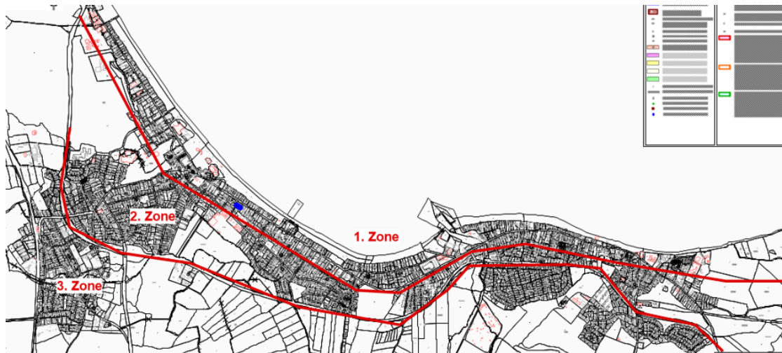
Bild 1: Zonierung vom 30.11.2017

Die beschriebene städtebauliche Gebietsstruktur soll aus Sicht der Gemeinde vom Grundsatz weiterhin beibehalten und in seiner Systematik vervollständigt werden. Allerdings wird diese in dem Punkt angepasst, dass das Gebiet der Zone 3 neu zugeordnet wird.