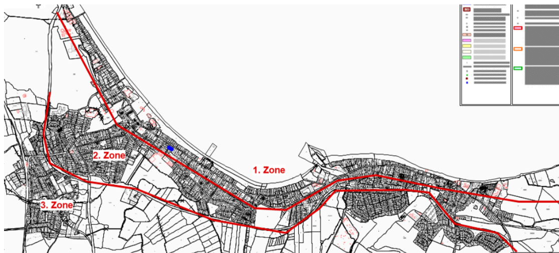
Bild 1: Zonierung vom 30.11.2017

Die beschriebene städtebauliche Gebietsstruktur soll aus Sicht der Gemeinde auch weiterhin beibehalten und in seiner Systematik vervollständigt werden.